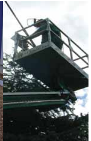
IL GIARDINO DI UNA CASA PRIVATA, L'AIUOLA DI UNO STABILE AZIENDALE, IL PINO DEL PARCO COMUNALE