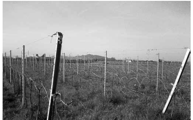
Il vigneto della fattoria, in via Quintino Sella

Noi, inoltre, daremo adeguato ritorno documentato sugli investimenti fatti e l'invito di venirci a trovare in qualunque momento per poter verificare di persona l'avanzamento dei lavori.✂