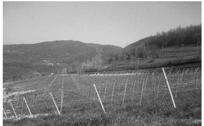
Il vigneto di San Vito

Abbiamo già iniziato a produrre vino, poco ma buono. L'abbiamo chiamato "IL VINO DI PAOLINO", Passito la prima edizione, vendemmia 2011, letteralmente andato a ruba durante le scorse feste di Natale. Ora, primavera 2014, abbiamo disponibile il PASSITO vendemmia 2012 e il GARGANEGA vendemmia 2013, sempre marchiati "Il vino di Paolino". Provare per credere!