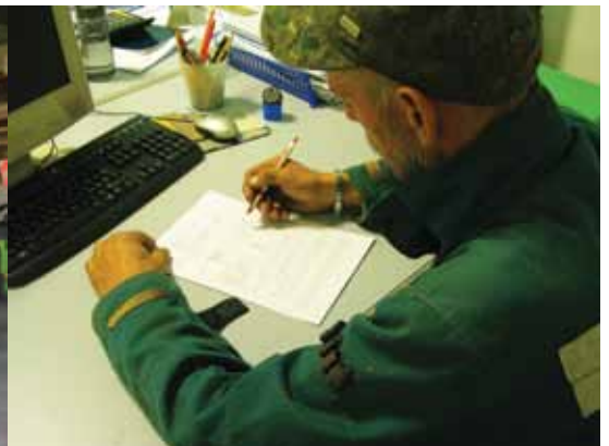
ORE 17.30: SI RITORNA A CASA, SI PARCHEGGIANO LE ATTREZZATURE E SI COMPILA IL DIARIO DI BORDO. IL LAVORO DI OGNI GIORNO VA DETTAGLIATAMENTE RIPORTATO.