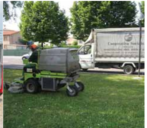
SI PREPARANO TRATTORE NUOVO FIAMMANTE E RASAERBA E... SI PARTE!