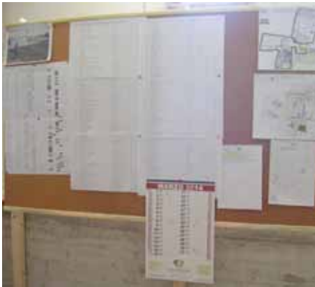
ORE 7.00: UNO SGUARDO AL TABELLONE DEL PROGRAMMA

Le tappe di una giornata tipo dei nostri giardinieri